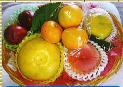
果物のお供え物セット