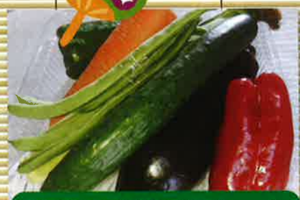
野菜のお供え物セット