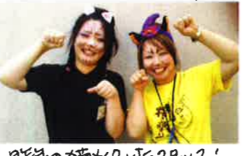
お祭りのお楽しみは、お祭り!