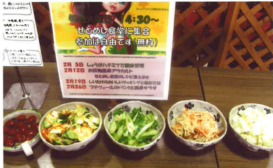
トマトみりん漬け しょうゆ漬け 白だし漬け みそ漬け ゆず大根