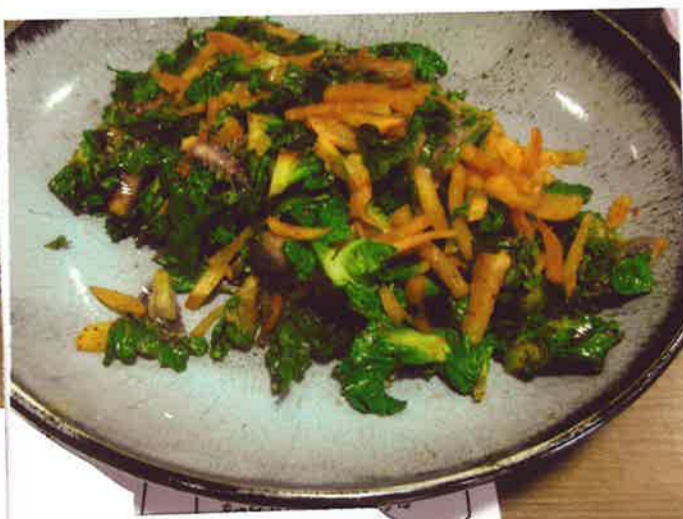
プチベールたくあん

にんにく・オリーブオイルフライパン で炒め、にんじん火が通ったら トマト、プチベール、味付けは 塩・ブラックペッパーでお好みで。 きのこ類、ペコニはと入れると もっとおいしい一品です。