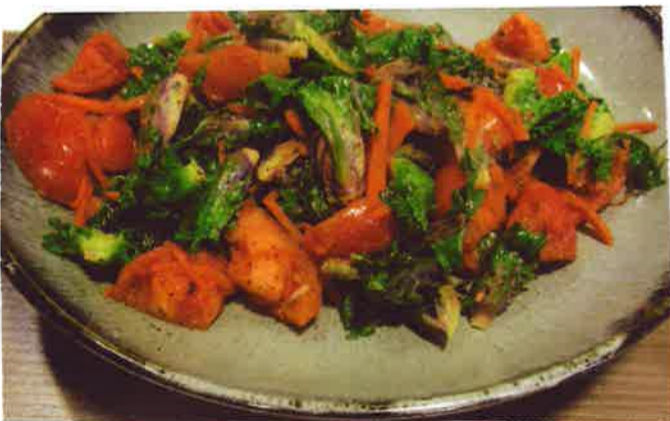
トマトとプチベール炒め

にんにく・オリーブオイルフライパン で炒め、にんじん火が通ったら トマト、プチベール、味付けは 塩・ブラックペッパーでお好みで。 きのこ類、ペコニはと入れると もっとおいしい一品です。