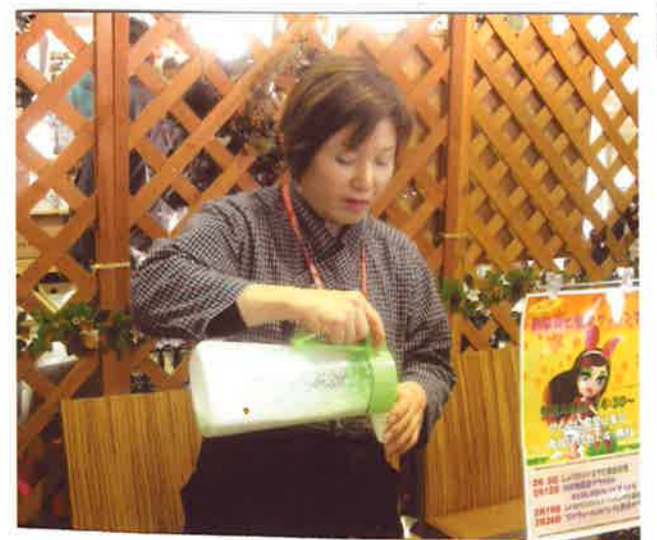
プチベールジュース

プチベール + リンゴジュース プチベール + 牛乳 + はちみつ ミキサーでシェイクして出来上り