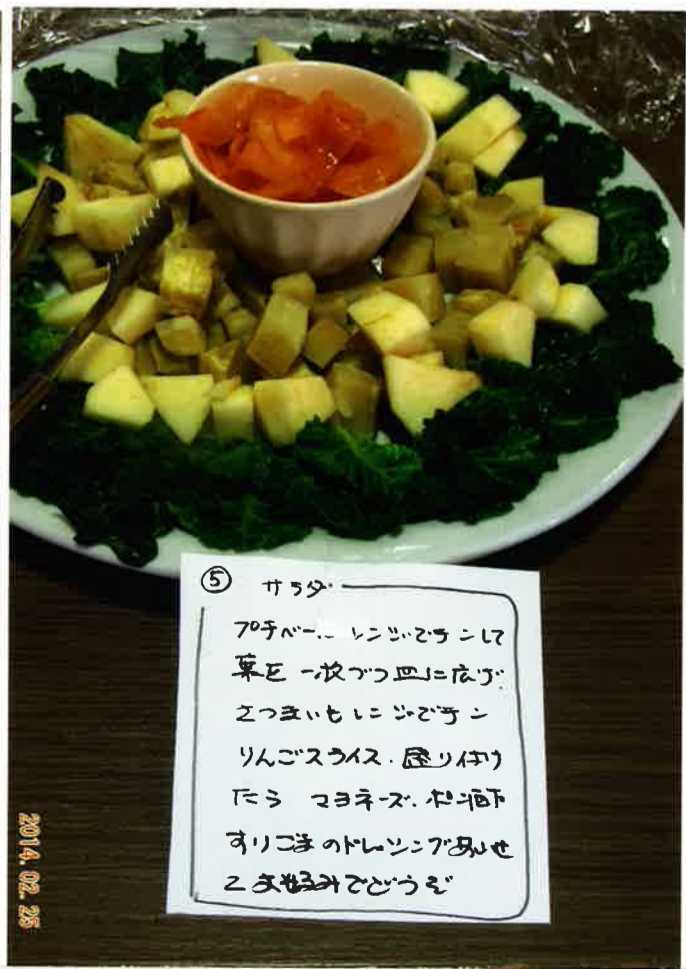
⑤ サラダ プチベール レンジでチンして 果菜 一枚ずつ皿に盛り 2つまひにレンジチン りんごスライス. 盛り付け たまごネズ. 油揚げ すりごまのドレッシング 2分程レンジでチン