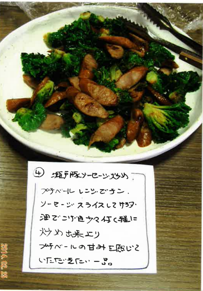
④ 瀬戸原ソーセージ炒め プチベール レンジでチン. ソーセージスライスして炒め 油で炒め色少々付く程に 火止め出来より プチベールの甘みで感じ いたまごにー品。