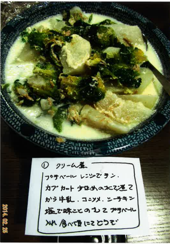
① クリーム煮 プチベール レンジでチン. カット少ゆめの水で煮て から牛乳. コシメ. ニーチキン 塩で味ここのちプチベール MM 倉へ運にことうぞ