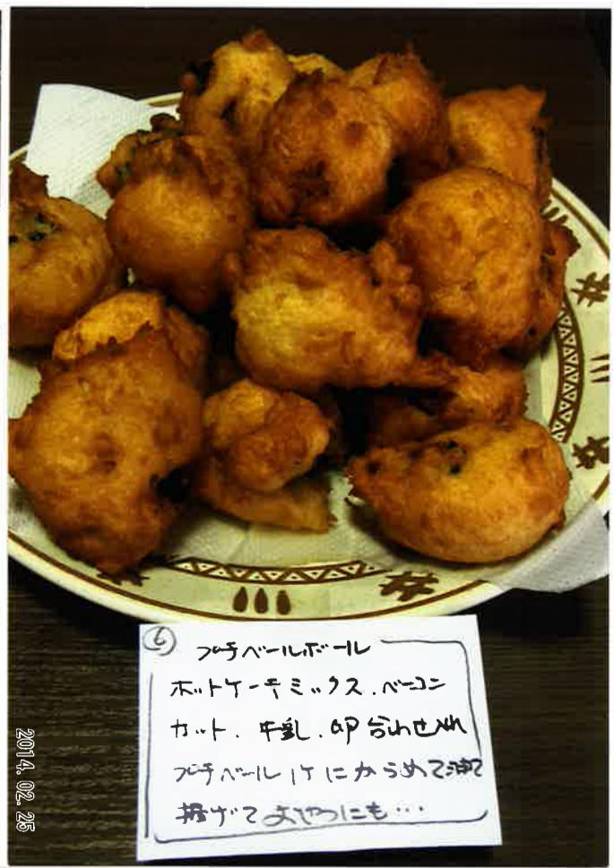
⑥ フォチベールボール ホットケーキミックス. パン カッター. 牛乳. AP 台にMM プチベール 1つにからめて油 揚げたてでおいしく...