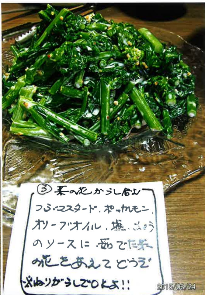
③ 菜の花からし合のサラダ ツユクサ、マスタード、お酢、オリーブオイル、塩、しょうゆ のソースに、お好みの野菜 を混ぜて楽しむ 菜の花からし合のサラダ!!