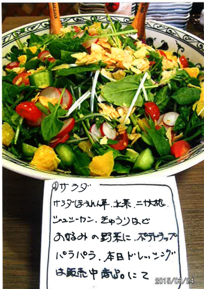
① サラダ ほうろく、ほうろく、白菜、ニラ、人参、 ツユクサ、カン、きゅうり、トマト お好みの野菜に、お好みの ドレッシング、本日ドレッシング は販売中商品にて