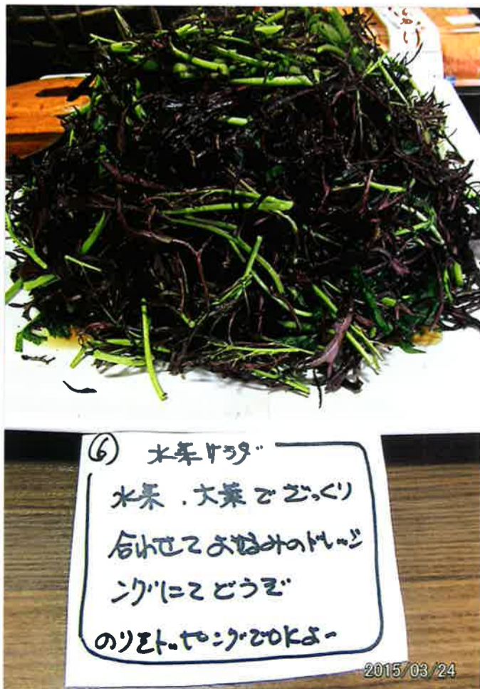
⑥ 水菜サラダ 水菜、大葉、ごぼう、 合せてお好みのドレッシング にかけて楽しむ のり、お酢、しょうゆ、 しょうが、お酢、しょうゆ