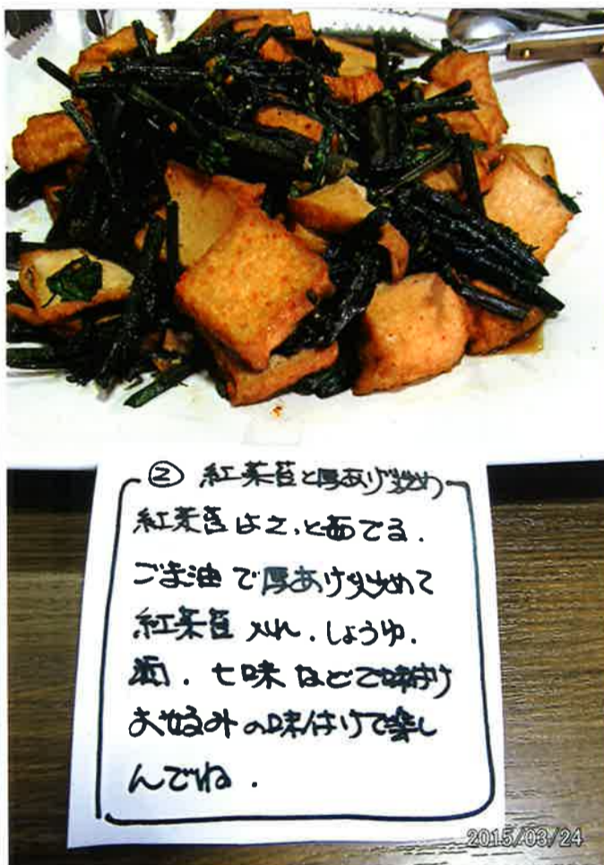
② 紅菜豆と厚揚げの炒め物 紅菜豆は之、と面する。 ごま油で厚揚げを炒め、 紅菜豆、しょうゆ、 酒、七味はちみつで味付け お好みの味付けで楽し んでね。