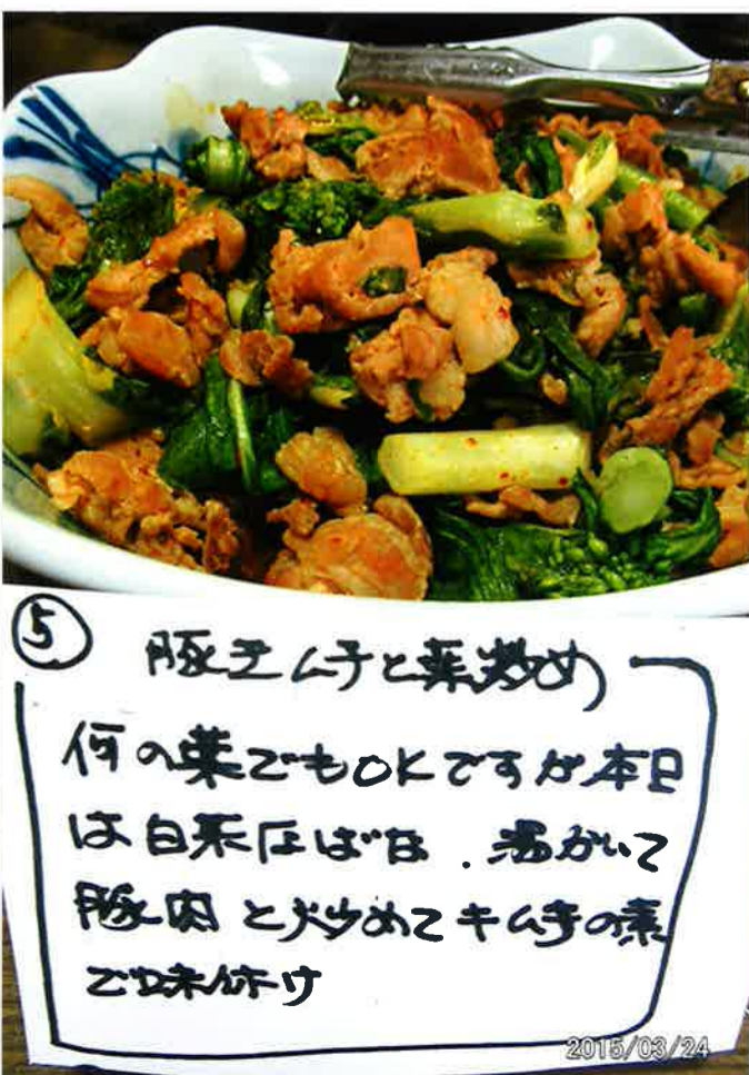
⑤ 豚キムチと菜の花の炒め物 何の菜でもOKです。本日は は白菜はちみつ、お酢、 豚肉と大さじ2キムチの素 で味付け