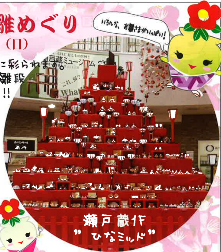
瀬戸蔵1F ”ひなミッド”

期間中、瀬戸の街中がお雛さまで華やかに彩られます。 陶磁器やガラスの創作雛で飾り付けた巨大な雛段「ひなミッド」(瀬戸蔵1F設置)は圧巻です!! その他、各種体験教室や行事も開催されますので、是非お出かけください!! ※詳しくは下記の観光協会HPをご参照ください