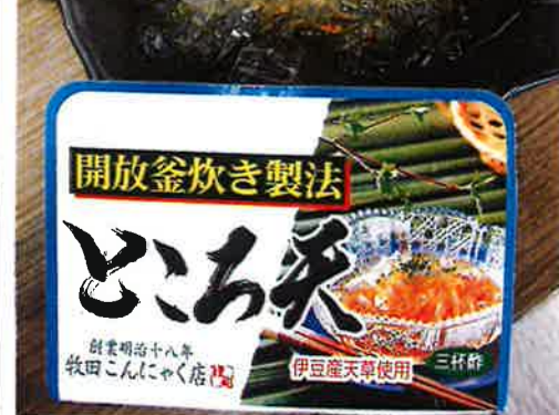
開放釜炊き製法 とろろ天 創業明治十八年 牧田こんにゃく店 伊豆産天草使用 三杯酢