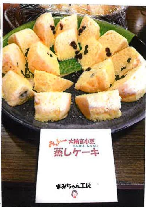
お豆大納言小豆 蒸しケーキ まみちゃん工房