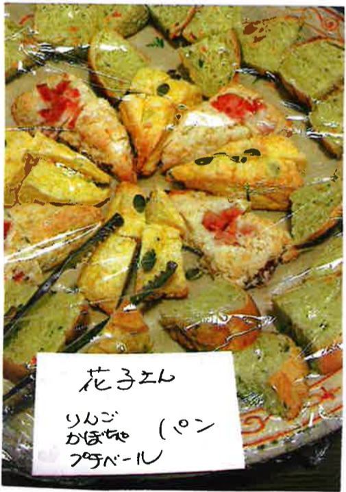
花子エト りんご かぼちゃ (ポン) アサヒール