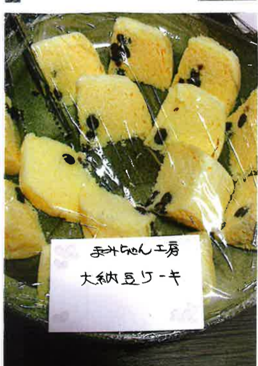
まみちゃん工房 大納言豆ケーキ