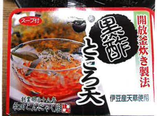
開放釜炊き製法 とろろ天 創業明治十八年 牧田こんにゃく店 伊豆産天草使用