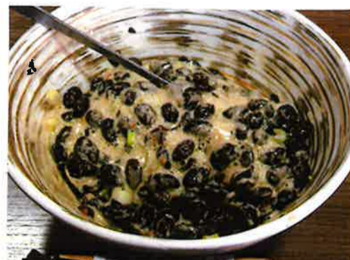
豆腐屋さんのゆき大粒 器2コッ 糸内 黒豆 安心 瀬戸の 花嫁 国産