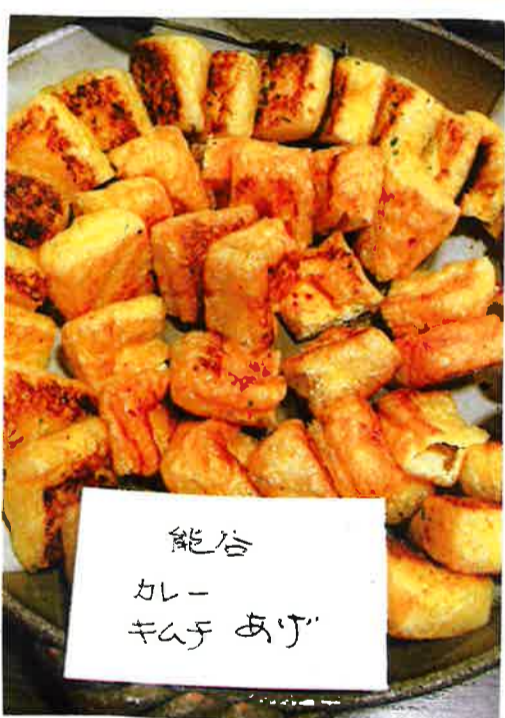
能谷 カレー キムチ あげ