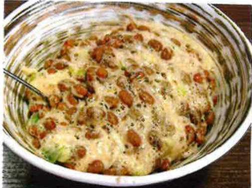
豆腐屋さんのゆき大粒 器2コッ 糸内 豆 安心 瀬戸の 花嫁 国産