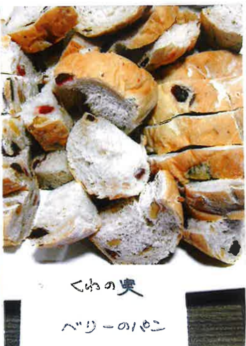
くゆの奥 ベリーのリボン