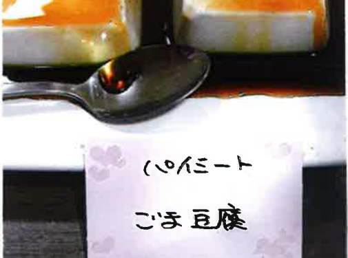
いんじーと ごま豆腐