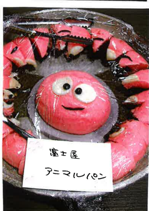
富士屋 アニマルパン