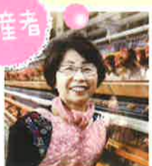
宮下ファームさん